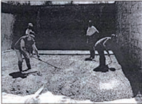
Les travaux sont réalisés par des bénévoles du club

Cette salle aura également comme seconde vocation, le tir à l'arbalète Field, avec nécessairement la réalisation d'un planning des jours et heures d'utilisation, sachant que les tireurs se déplacent pour récupérer leurs fiches plantées dans des cibles si-