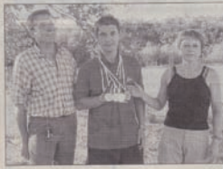
Des parents fiers de leur fils

pistolet. Quel palmarès pour ce jeune Auxonnaise ! Trois fois champion de France en 2003, deux fois champion de France par équipe, il est aujourd'hui champion d'Europe en pistolet sport 22 à Pilsen (République Tchèque), champion d'Europe par équipe en pistolet sport 22, champion d'Europe par équipe en pistolet standard, médaille de bronze en pistolet standard, médaille de bronze par équipe en pistolet libre.