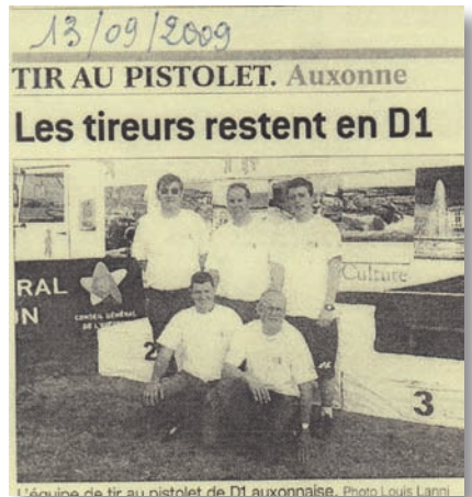
L'équipe de tir au pistolet de D1 auxonnaise.